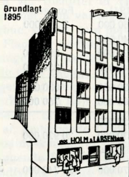
10 Aars Garanti