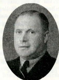
E. C. Poulsen Od.