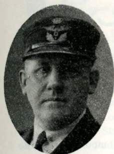
Aa. Møllebro Hgl.