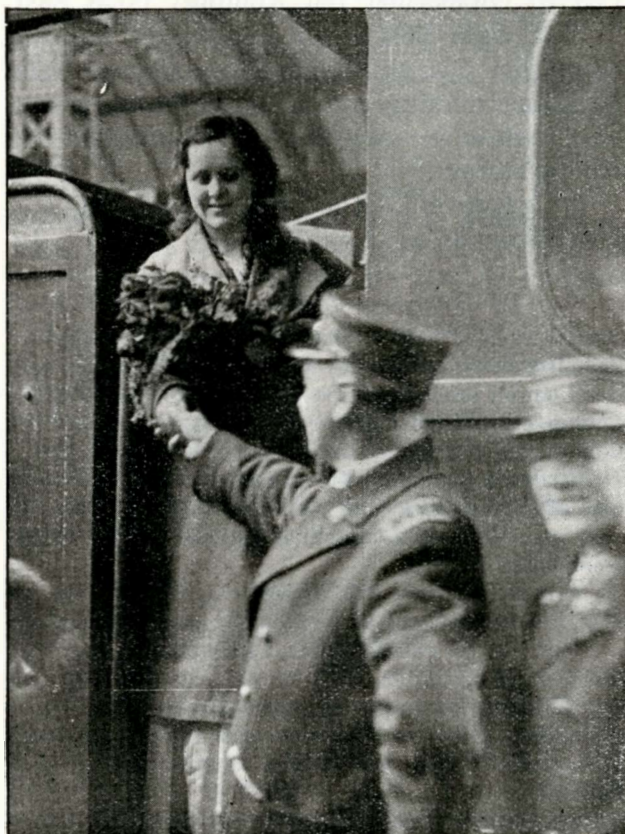
Ved Ankomsten til København. Jernbanedronningen hilser paa Lokomotivføreren.