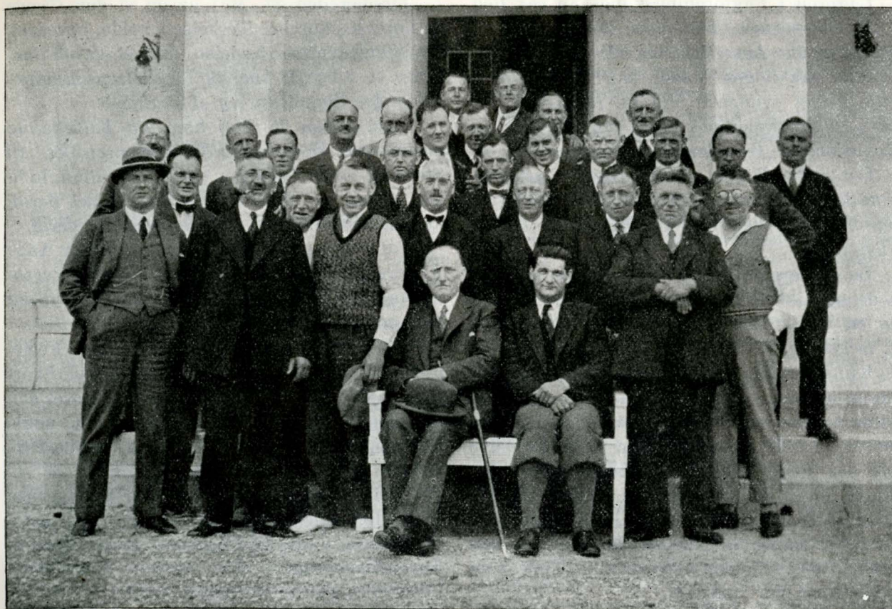
Studiekredsdeltagere og Ledere paa Feriehjemmet 1932.

Statstyre og Kommunestyre, og om Aftenen Foredrag af Journalist Eriksen om »Mødeteknik«.