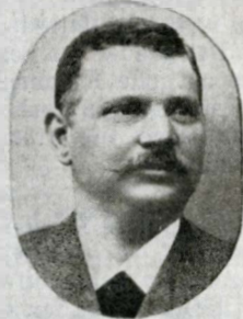
N.E.L.D. Schophuus Skriver