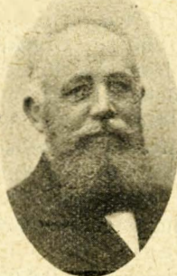
C.A. Lillelund København.