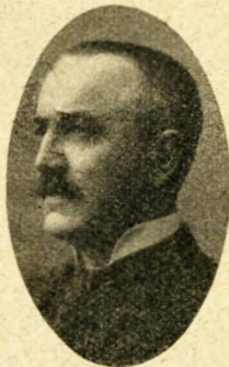
M.C.C. Olsen Holstebro.