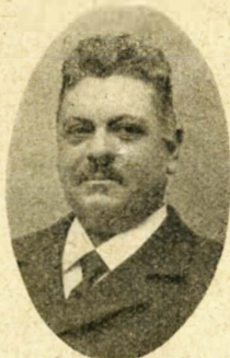
C.C. Nielsen København.