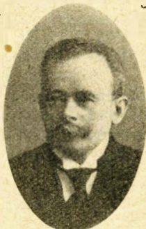
C.L. Bruun København H.