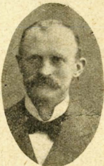
F.E. Birnbaum København S.