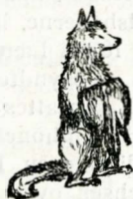
Tlf. Taga 1118

Altid stort Lager af Rejse- prøver til ca. halv Pris.