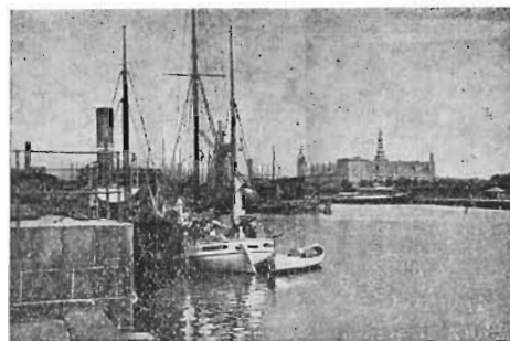
Helsingør Havn med Kronborg i Baggrunden.

Ved Udarbejdelsen er benyttet: Trap: Danmark II og Carl Behrens: Vandringer i Nordsjælland.