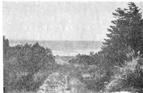
Kig fra Hornbæk Plantage ud over Sundet.

Ad Skovvejen naar De en Korsvej. Der er Bøg ved venstre Side af Vejen, Gran lidt inde ved den højre. Ved denne Korsvej gaar De tilhøjre og kommer lidt efter ned til en Bæk, fra hvilken der er herligt Kig ud over Sundet.