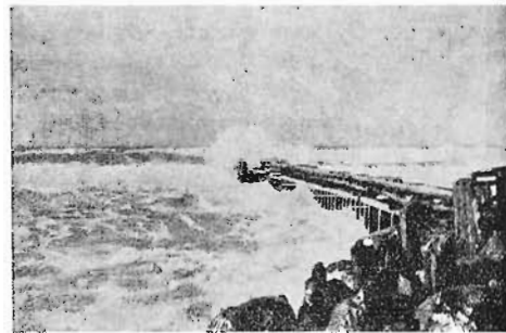
Kattegat i Oprør.

Vejen ligger højt, og De har vid Udsigt over Land og Hav. Tilvenstre for Vejen — ud mod Kattegat —