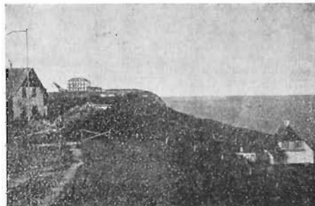
Gilbjerg, set fra Gilleleje.

Stien følger Kysten, og snart faar De fra Bakkerne fri Udsigt til Kattegat. Det tager ikke mere end en Snes Minutter at komme ad Stien ud til Gilbjerg, der er Sjællands nordligste Spids.