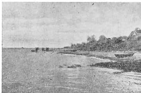
Strandparti ved Aalsgaarde.

Dybt nede ligger Havet, og Lyden af dets rytmiske Bølgeslag naar paa en stille Sommerdag knapt nok op til Højens Top. Havets Uhyrer slumrer. Deres Aandedræt er regelmæssigt og tyst. Solens Straaler kærtegner Fiskerkutternes hvide Segl og lægger en gylden Stribe over den svenske Kysts rige og afvekslende Linje, som ender brat med Kullens skarpe Silhuet.