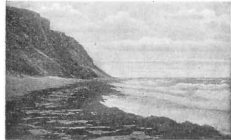
Parti ved Nakkehoved.

Ca. 40 Meter over Havfladen — i Rundetaarns Højde — staar De pludselig Ansigt til Ansigt med Kattegat. Det giver et lille Sæt i Dem, naar De kigger ned ad den stejle Skrænt. Mildt og svalt stryger Vinden ind