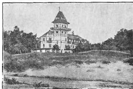
parti ved Hulerød.

Der er fra den højtliggende Vej en Udsigt, der faar Dem til at standse et Øjeblik. Villingebæk Teglværk ligger lige nedenfor Dem. Dets høje Skorstene dominerer lidt rigeligt i Landskabet. Fra Teglværket ruller Tipvognene ad en lang Bro ud i Kattegat til de Skuder, der skal lades med Teglstene. Hinsides Bugten rager Hulerød Badehotel med sit lille Taarn op af Plantagen,